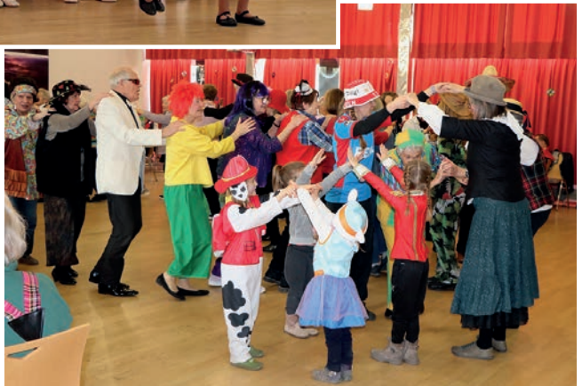
Zwischendurch wurde getanzt und gesungen.