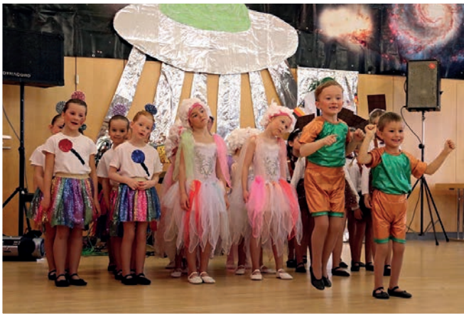
Die Rasselbande des MGV versüßte mit ihrem Candy-Shop-Tanz den Nachmittag.